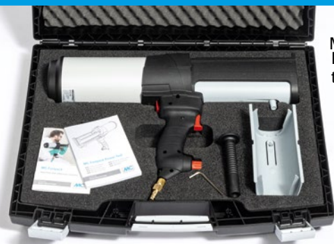
MC-Fastpack Power-Tool toimitussisältö