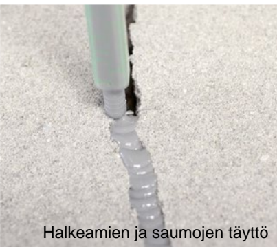
Halkeamien ja saumojen täyttö