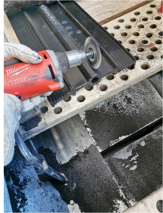
4. Karhenna pinta