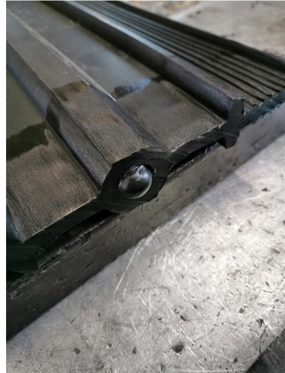
6. Aseta "raakapistoke" keskimmaiseen putkeen