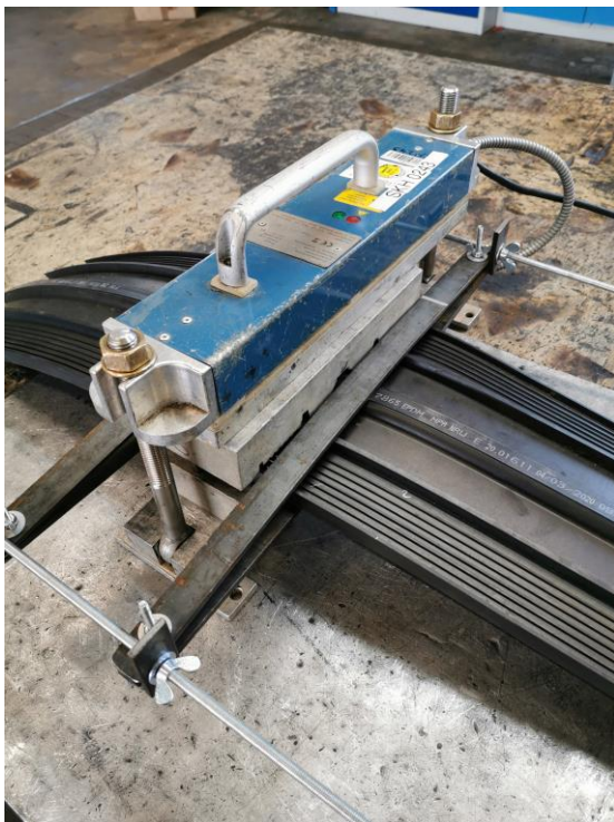
13. Aseta matriisi kuumennettuun koneeseen