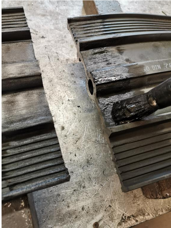
5. Levitä pinnoitusliuosta