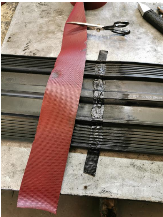
9. Levitä raakakumisoiro 80x3 mm, paina varovasti, ja sen päälle levitä 50x3 mm.