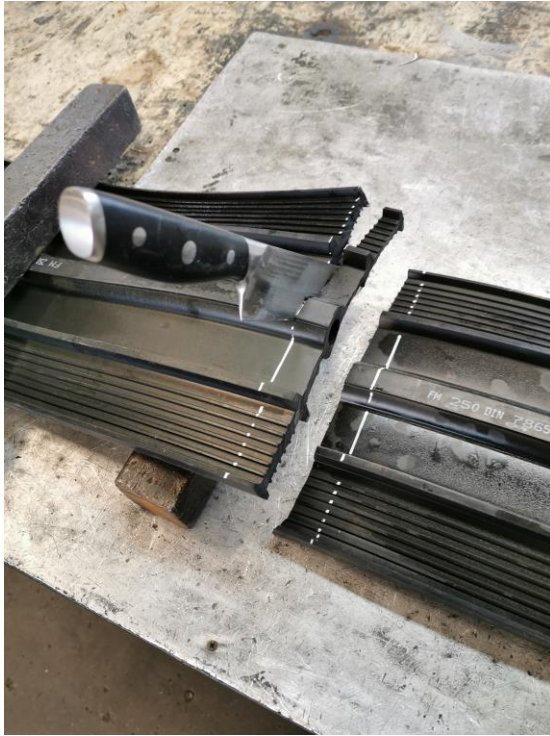
3. Leikkaa veitsellä (käytä vettä liukasteena)