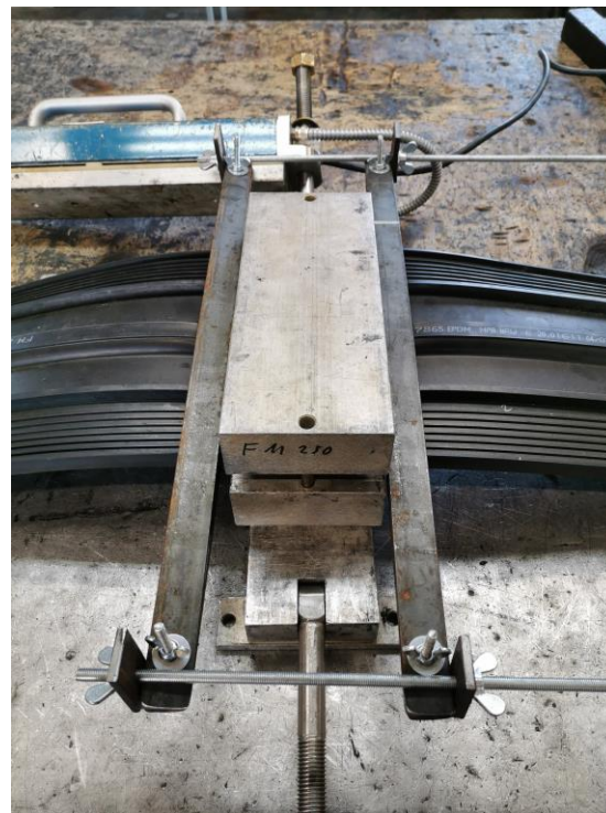
12. Aseta liitos matriisiin