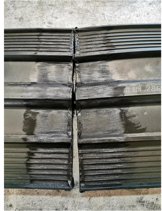
8. Yhdistä profiilit