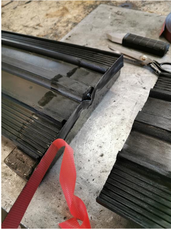
7. Levitä raakakumia etupinnalle