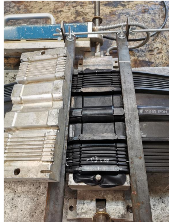
16. Avaa kone