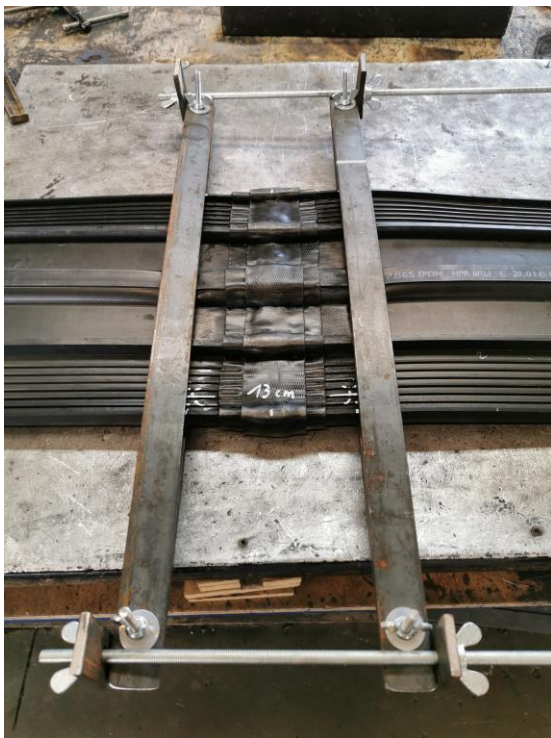
11. Aseta "kehys" kiinnittämään liitos