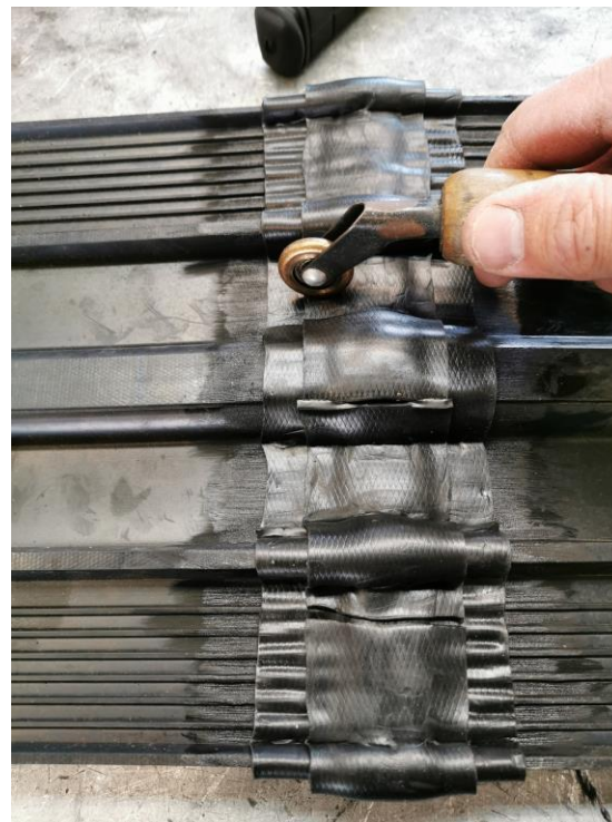
10. Paina raakakumi varovasti